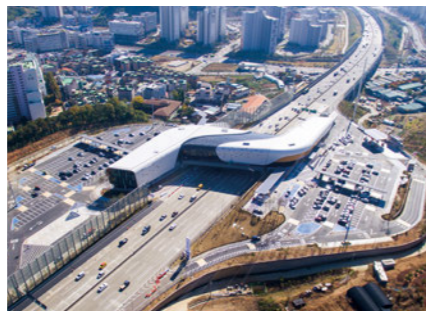
Bridge Square (Siheung Aerial Service Area) 시흥하늘휴게소 (시흥 본선상공형 휴게시설) [E]