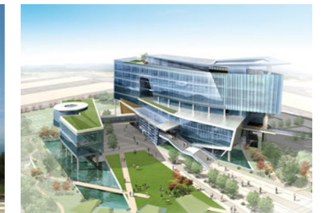
Jeollabukdo Office of Education 전라북도교육청 [E]