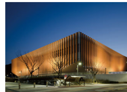
Incheon Asia Games Ganghwa Stadium 2014 2014 아시아경기대회 강화경기장 [A]