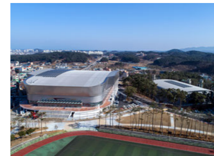
Kwandong Hockey Center 관동 하키 센터 (강릉 아이스하키II 경기장) [A]