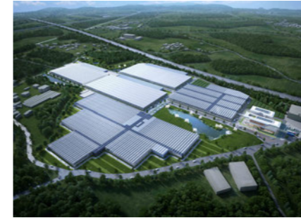
Jeonbuk Smart Farm Innovation Valley 전북스마트팜 혁신밸리 핵심시설 [E]