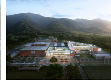
Dormitory/Fitness Center of Icheon Training Center 이천 훈련원 생활관 및 체력단련장 [A]