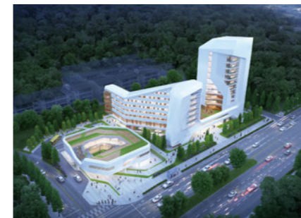
ETRI Dormitory 한국전자통신연구원 기숙사 [E]