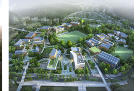
Administrative City (6-4) Multi-Community Complex 행정중심복합도시 6-4생활권 복합커뮤니티단지 [E]