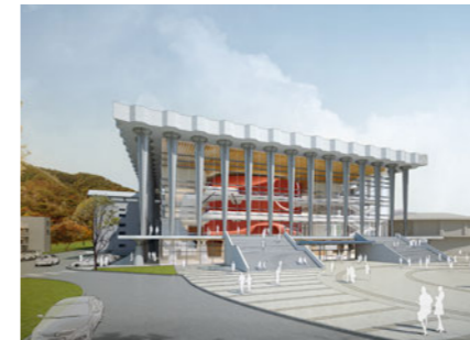
Haeoreum Grand Theater of the National Theater of Korea 국립극장 해오름 [E]