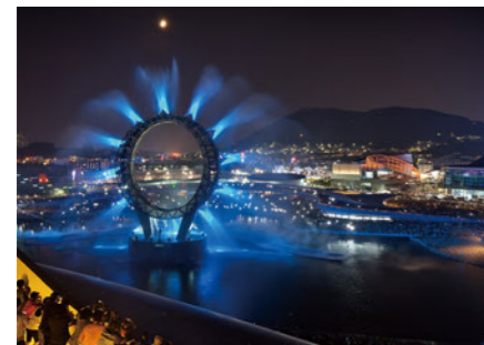
Big-O, International Exposition 2012 2012 여수엑스포 BIG-O [E]