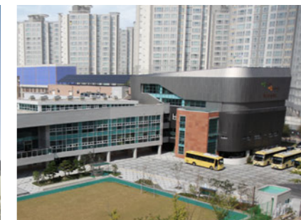
Busan Hansol Special School 부산한솔학교 [E]