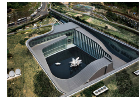
Seoul Memorial Park-Cremation Facilities 서울 추모공원 [A]