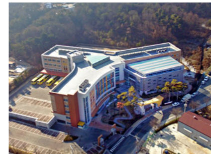
Icheon Dawon School 이천 다원학교 [E]