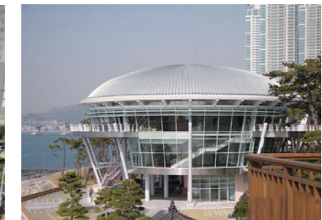
APEC Summit Conference Hall 누리마루 APEC 정상회의장 [A]