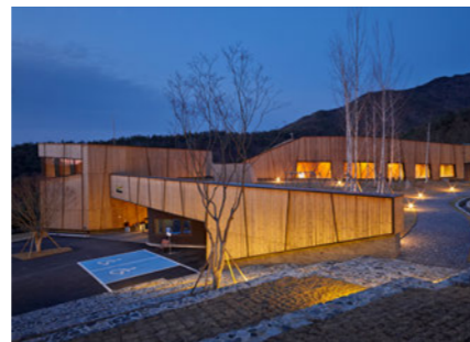
Pulmuone LOHAS Soopchaewon 풀무원 로하스아카데미 [A]