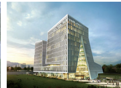
GERI 구미첨단의료기술타워 [E]