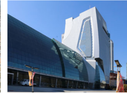
Changwon Exhibition Convention Center 창원컨벤션센터 [E]