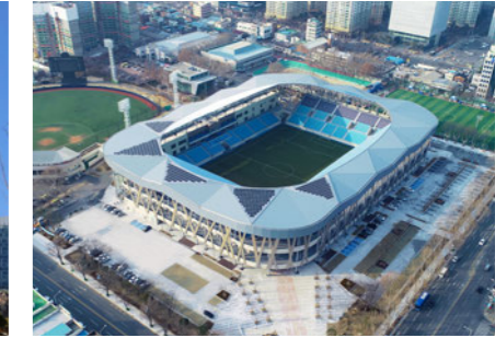
DGB Daegu Bank Park DGB 대구은행 파크 [A]