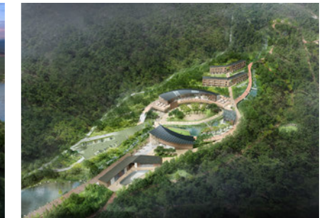
National Center for Forest Activities, Naju 국립나주숲체원 [A]