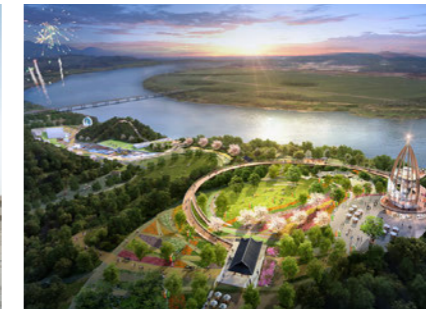
Nakdonggarm Waterside History Park 낙동가람 수변 역사누림길 [A]