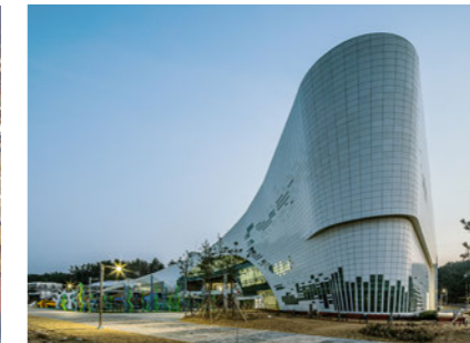
National Ocean Science Museum 국립해양과학관 [E]