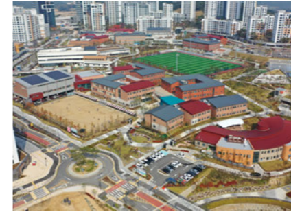
Haemil School 세종 해밀학교 [E]

2021년도 대한민국 우수 교육시설 대상 (교육부 / 세종 해밀학교) 제6회 한국문화공간상 공연장 부문 ((사)한국문화공간건축학회 / 밀양아리랑아트센터) 제8회 창원시 건축대상제 공공부문 은상 (창원시 / 창원컨벤션센터) 2019 대구건축상 공공분야 최우수상 (대구시 / DGB 대구은행 파크) 2018 굿디자인 어워드 국무총리상 (산업통상자원부 / 시흥하늘휴게소 (동부건설)) 경기도건축문화상 사용승인부문 입선 (경기도지사 / 경기도구리남양주교육지원청) BIM AWARDS 2017 빌딩스마트협회장상 ((사)빌딩스마트협회 / 국립극장 해오름 리모델링) 2017 대한민국 녹색건축대전 우수상 (국가건축정책위원회 / 강원체육회관) 2016년도 대한민국 우수시설학교 특수학교부문 대상 (경기도교육청 / 이천 다원학교) 2016 국제청소년공간대전 초대작가전 "올해의 건축상" ((사)한국청소년시설환경학회 / 국립해양과학관) 성공적 과업 수행 장관 표창장 (국토교통부 / 모후산 강우레이더 관측소) 2015 국토도시디자인대전 주거 및 상업업무단지 부문 대한민국도시계획학회장상 (인천광역시(경제자유구역청장) / 경원재 엠베서더 인천) 제16회 전라북도 건축문화상 (전라북도 / 전북은행 배드민턴 전용구장) 2014 대한민국 공공건축상 국무총리상 (국토교통부 / 성남판교 어린이도서관) 2014 한국건축문화대상 준공건축물부문 우수상 (대한건축사협회 / 디아크 문화관) 2014 한국건축문화대상 "민간부문" 대통령상수상 (대한건축사협회 / 풀무원 로하스 숲체원) 건설사업 품질 및 사후관리 평가 표창장 (인천광역시 / 2014 아시아경기대회 강화경기장) 제2회 교육시설 초대작가전 올해의 작품상 ((사)한국교육시설학회 / 부산한솔학교) 2013 부산다운 건축상 (부산광역시 / 부산광역시학생예술문화회관) BIM Design Award 2012 Good Practice ((사)빌딩스마트협회 / 성남판교 어린이도서관) BIM Design Award 2011 Good Practice ((사)빌딩스마트협회 / 디아크 문화관) BIM 디자인어워드 2011대상 ((사)빌딩스마트협회 / 한국남동발전(주)본사사옥) 2010/2011년 국제공공디자인대상 공모전 Junior Grand Prix ((재)한국공공디자인지역지원재단 / 시흥 본선상공형 휴게시설, 마장북합문화시설) 2009년 한국FM대상 민자사업부문 설계분야 대상 ((사)한국퍼실리티매니지먼트학회 / 신길초등학교 외 3교) 경상북도 건축대전 초대작가상 (경상북도 / 안동 유교문화 체험센터) 2007년 우수시설학교 최우수상 (교육인적자원부 / 경기예술고등학교 예술관) 국민체육진흥공단 표창장 (국민체육진흥공단 / 광명 돔 경기장)