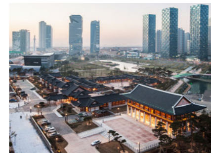
Gyeongwonjae Ambassador Incheon 경원재 앰배서더 인천 [E]